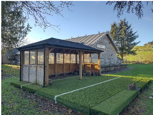
Ystafell Ddosbarth Awyr Agored