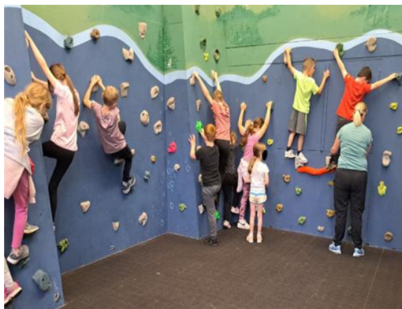
Wal Ddringo Dan Do