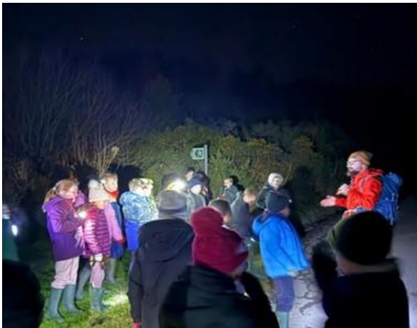
Taith Gerdded Gyda'r Nos