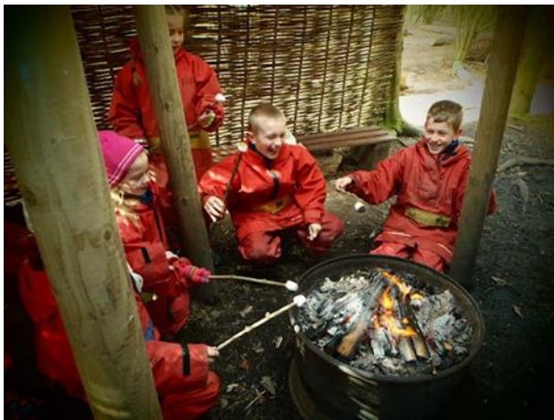
Byw yn y Gwylt

Rydym yn gwneud llawer o weithgareddau difyr ym Mhentrellyncymer. Mae'n beth da rhoi cynnig ar weithgareddau newydd. Bydd staff yno i fy helpu i. Mae'n rhaid i fi ddilyn cyfarwyddiadau a gwneud beth mae fy athrawon yn ei ofyn i fi wneud. Mae'n rhaid i fi wrando ar yr hyfforddwyr o Bentrellyncymer hefyd a dilyn cyfarwyddiadau. Os bydda i'n gwneud y pethau hyn, bydda i'n saff a bydda i'n cael amser gwych! Bydda i'n teithio ar fws mini i gyrraedd rhai gweithgareddau. Dyma rai o'r gweithgareddau bydda i'n eu gwneud ym Mhentrellyncymer.